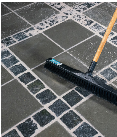
7. Överflödigt fogmaterial sopas bort.