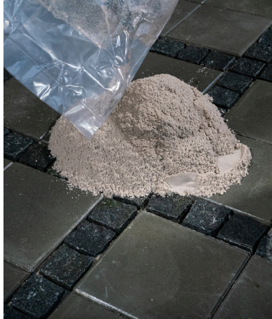
2. Häll ut Benders Lithomex Quicksand på din beläggning.