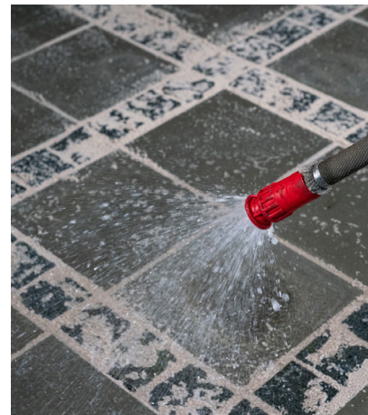
6. Skölj och efterfyll sedan eventuella hålrum.