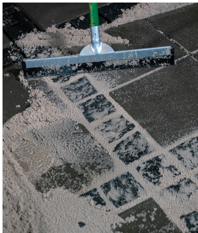
5. Fogarna ska vara helt fyllda, och minst 30 mm djupa.