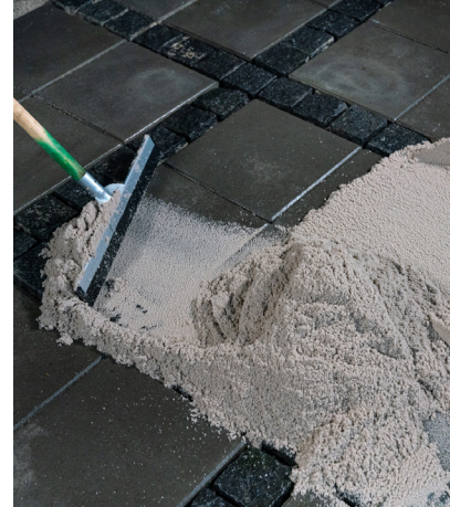
3. Benders Lithomex Quicksand skrapas in i fogarna med en gummiskrapa.