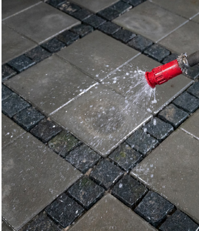
1. Beläggningen skall fuktas väl före fogning.