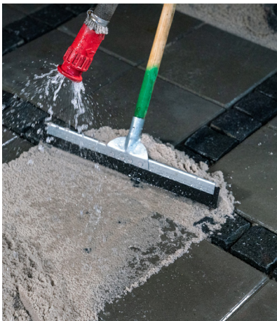
4. Fogmaterialet vattnas sedan ner med ett duschmunstycke, använd lågt tryck.