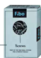
Skruv/Screws 40 stk/40 pcs